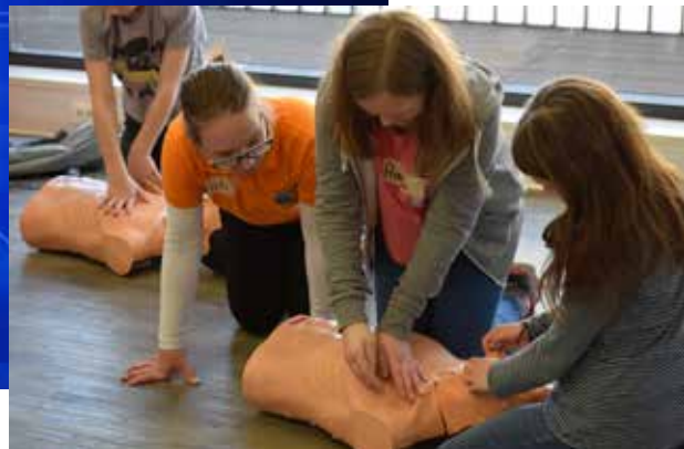
Erste Hilfe-Station: Die Kinder lernen die Herz-Lungen-Wiederbelebung.

Wenn ein Mensch nicht mehr atmet, dann ist die Herz-Lungen-Wiederbelebung die Maßnahme, mit der Ersthelfer/-innen Leben retten können. Darum ist es wichtig, mit dieser Maßnahme frühzeitig vertraut zu werden. Die Kinder konnten an Phantomen ausprobieren, wie es ist, wenn man einem Menschen auf den Brustkorb drückt und ihn beatmet. „Es ist gar nicht so schwer, wenn man sich nur traut“, war dabei die einhellige Meinung.