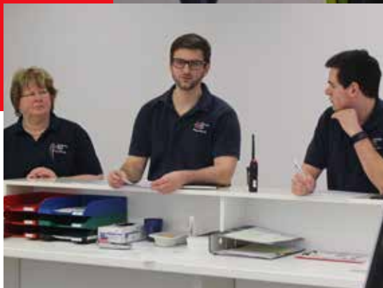
Ein Rundgang durch die Halle 3.1 auf der Ambiente 2018.